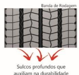
Figura 2. Sulcos centrais