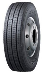
Figura 1. Espessura da borracha