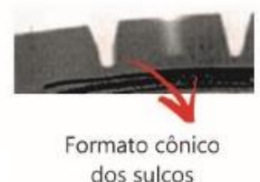
Figura 3. Sulcos